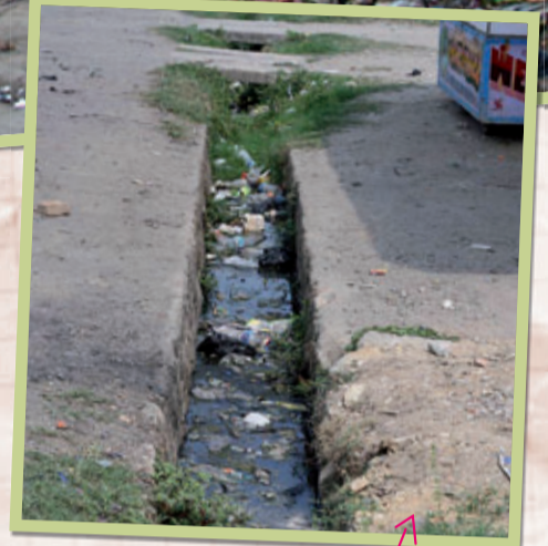
Niet echt een hygiënisch watersysteem

Nepal is een van de armste landen ter wereld. Er wonen meer dan 25 miljoen mensen waarvan het grootste deel op het platteland woont. Deze mensen hebben een stukje grond waar ze rijst, mais en andere gewassen op verbouwen en ze hebben een koe, een varken en een paar kippen. De bevolking groeit en doordat ze steeds meer landbouwgrond nodig hebben, wordt er veel bos gekapt. De mensen op het platteland leven van wat hun land opbrengt en wat ze uit het bos kunnen halen. Van een Mars of een Bounty hebben ze nog nooit gehoord en plastic gebruiken ze niet.