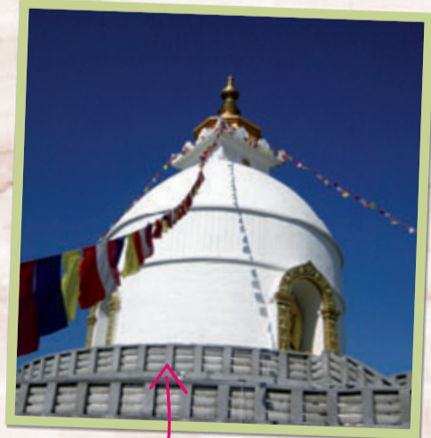
Pagode in Pokhara

Een keer in de zoveel tijd, als het te erg wordt, wordt alles bij elkaar geveegd en buiten de stad langs de weg gedumpt. Ook verbranden veel mensen hun afval. In Nederland mag je nog geen stukje hout verbranden maar hier wordt alles wat wil branden rustig in de fik gestoken.