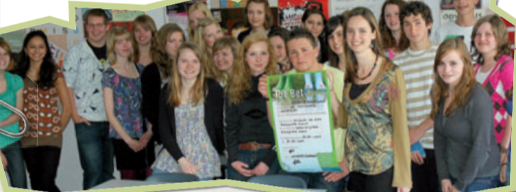
LEERLINGEN VAN HET DALTON COLLEGE ZIJN DE WEDDENSCHAP AANGEGAAN