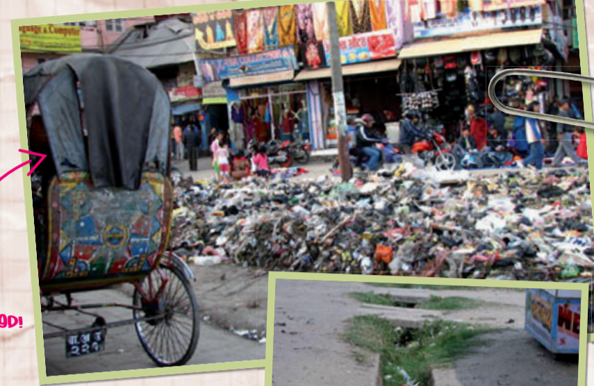
Het afval wordt 'keurig' aangeveegd!