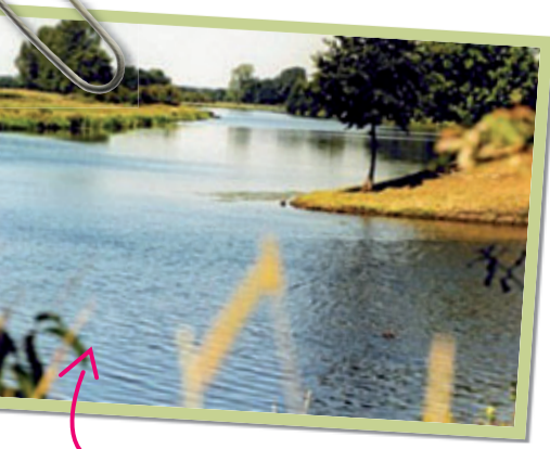
Zwemmen, zonnen, varen?

take 2 Zoek één of meerdere plaatsen om te overnachten. Kan je hier naartoe lopen, fietsen of is het per openbaar vervoer bereikbaar? Dit is natuurlijk allemaal veel milieuvriendelijker dan de auto of het vliegtuig. Misschien kan je wel in het huisje van familie die op vakantie is of ga je lekker kamperen in het weiland van een boer?